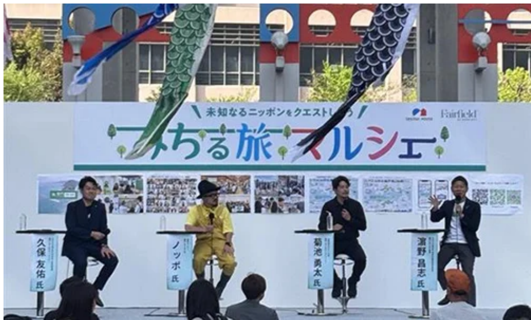
※トークセッション 昨年の様子

※出店内容やステージイベントは予告なく変更になる場合があります。予めご了承ください。